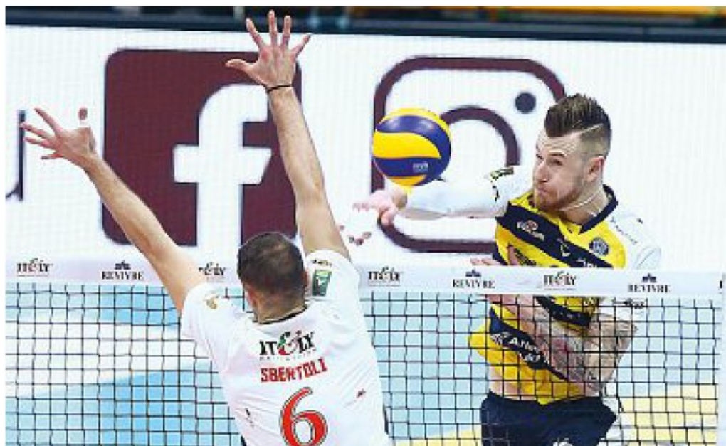
Bomber Ivan Zaytsev, 31 anni, capitano dell'Italia all'Europeo 2019 e alla seconda stagione con la maglia di Modena