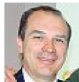
Righi Ad Legavolley

Purtroppo non avevamo alternative. Non c'era un'altra data disponibile